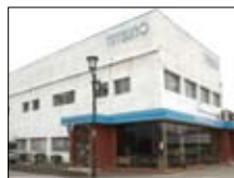
株式会社タツノ本社