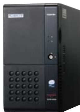
信頼性に優れた インテル® Xeon® プロセッサ搭載