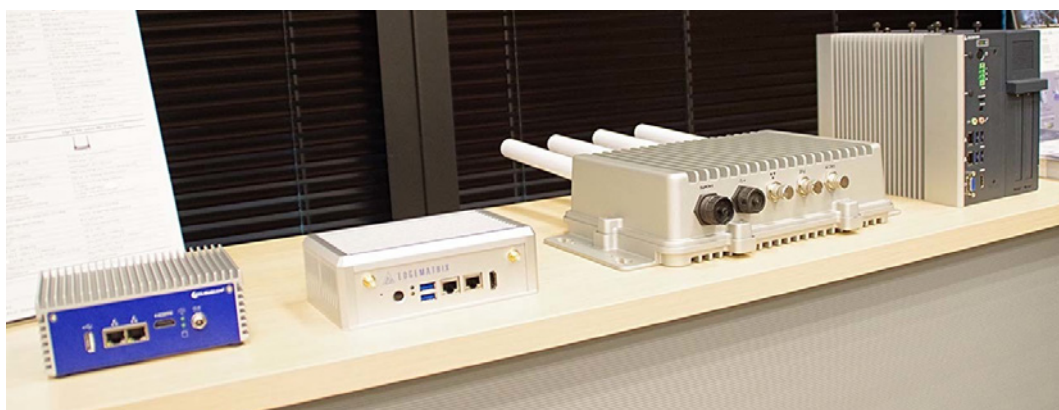
Edge AI Box の実機

る。同社はこれまで、車種判別による屋外広告など数多くの AI ソリューションを手掛け、実証実験 (PoC) 段階から商用段階へ移行する際に直面する多くの課題を解決してきた。これらの経験や知見をもとに、実用化を視野に入れたエッジ AI の開発を支援する。