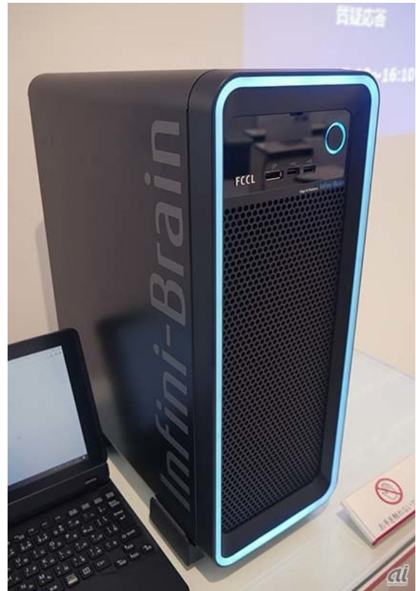
汎用型エッジコンピューター「Infini-Brain」

実際に、ドラッグストアにおいて 2019 年 3～7 月の 5 カ月間にわたり設置したところ、前年同期（2019 年 3～7 月）には 11 万 4773 円の被害額であったものが 7 万 8765 円へと減少。特に単価が高い化粧品エリアでは、2 万 5320 円の被害額が 3700 円にまで縮小。この間の被害額は 85%も下がったという。