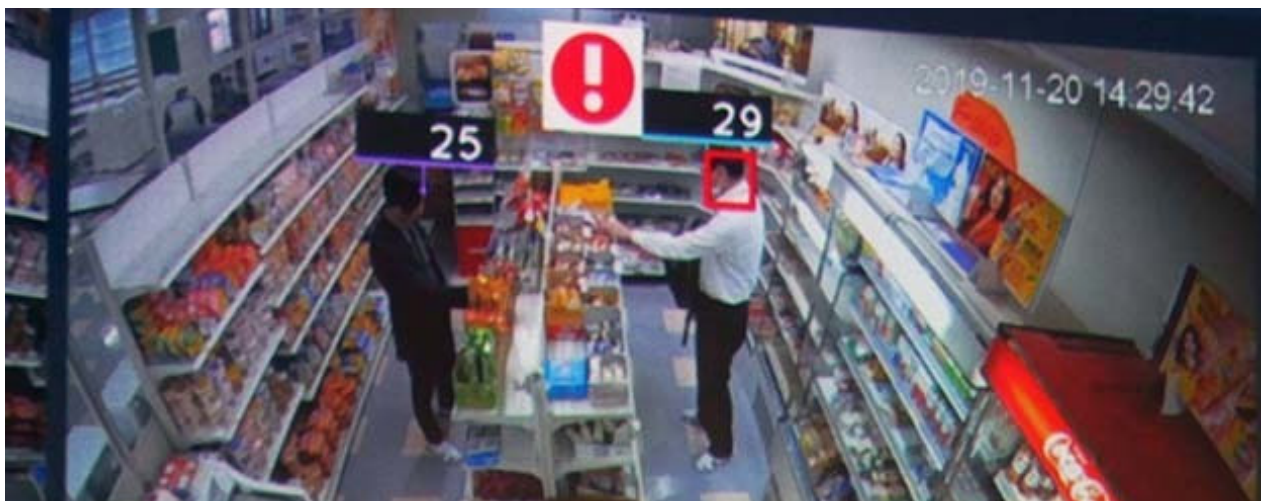
Infini-Brain と指向性スピーカーを使用して、島根富士通の売場でデモンストレーションを行った